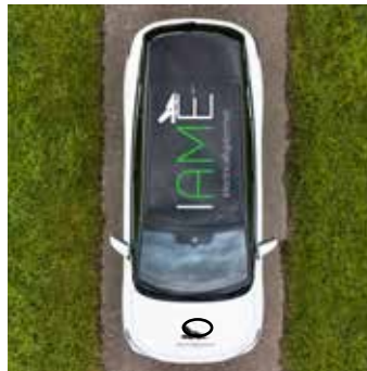
Keskkonnasõbralikum prindi- ja löikekilede tootepere