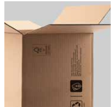
Rulli kast on valmistatud taaskasutatud/taaskasutatavatest materjalidest ja rulli kott on biolagunev.

Kuid need ei ole ainult 100% PVC-vabad kleebiskiled. Tootearenduses on lähtutud terviklikust lähenemisest, mis arvestab keskkonnaga kõikides valdkondades – kile pind, liim ja aluspaber ning rulli kott ja pakend.